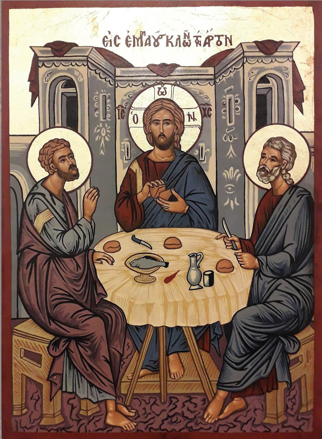
De Emmaüsgangers (icoon)

Uitgave van de Protestantse Gemeente te St.-Oedenrode, Son en Breugel