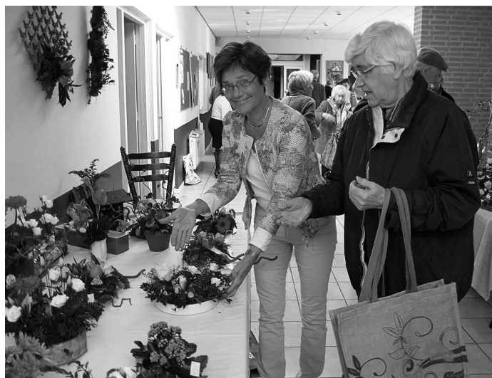
Zeg het met bloemen! (Paasmarkt 2019)